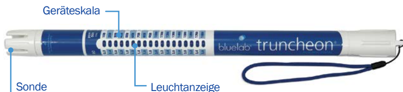
Figure 1. Bluelab Truncheon® Nutrient Meter

Mit dem Bluelab Truncheon® Nutrient Meter können Sie die Leitfähigkeit von Nährstoffen messen, indem Sie den Sensor der Sonde in die Nährlösung stecken. Die Sonde misst die Leitfähigkeit der Nährstoffe und zeigt den Wert mithilfe der Leuchtanzeige auf der Geräteskala an. Abb. 1 zeigt das Bluelab Truncheon® Nutrient Meter (Truncheon Meter) .